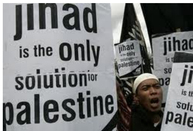
“Ҳизб ут-таҳрир” аъзолари антисемитизм ғояларини ёйиб, тинч аҳолини жиҳодга чорламоқда.

бундай қисқа вақт ичида инқилобни амалга ошириб бўлмайди, дея тўнтариш санасини яна 40 йилга чўздирди. Ваъда қилинган муддат ўтганидан кейин эса ташкилот раҳнамолари: “Ҳизб ут-таҳрир инқилобга эришиш йўлида тинимсиз ҳаракат қилмоқда. Аллоҳ инқилобни қачон ирода қилса, ўша вақтда содир бўлади”, - дея жавоб бериб қўя қолишди.