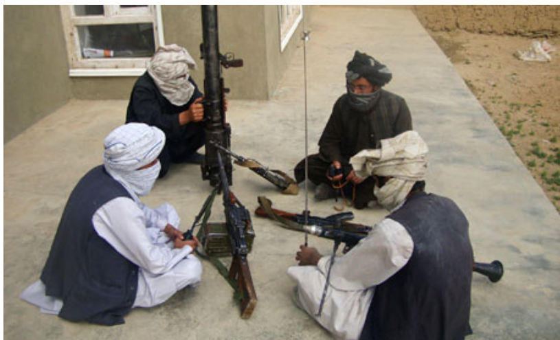
Афғонистондаги жангариларнинг навбатдаги кўпорувчилик олдидан қилаётган маслаҳати

Ҳокимият масаласидаги қарашлари учун «Ҳизб ут-таҳрир» демократия ва исломни бир-бирига зид икки хил тушунча сифатида талқин қилади. «Ҳизб ут-таҳрир»нинг қарашича: “Ҳокимият фақат Аллоҳга тегишли бўлиб, одамлар бу борада Унга қарамдирлар”. Халифа томонидан шариат асосида