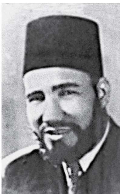
1928 йилда “Мусулмон биродарлар” экстремистик ташкилотга асос солган Ҳасан ал-Банно

Ўз номини ислом билан боғлайдиган радикал гуруҳлар дунё тажрибаси учун янги ходиса эмас. Ибн Таймия (XIII аср), Ибн Вахҳоб (XVIII аср), Ҳасан ал-Банно (1906-1949 йй.) ва Сайид Қутб (1906-1965 йй.) ғояларини бугунги кундаги экстремистик тоифалар ўзлари учун асосий манба деб биладилар.