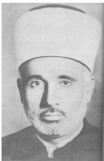
“Ҳизб ут-таҳрир” партияси асосчиси Такиуддин Набаҳоний

лари эса, аксинча, муаммо мусулмон мамлакатлари мустақилликни қўлга кири-тишлари ва иқтисодий салоҳиятларини яхшилашлари билан ҳал бўлади деб ўйлар-ди. Набаҳоний одамларни куфрда айблади. Унинг наздида кишилар турли идеоло-гик хилма-хилликка берилиб кетган ва асл исломий ғоялардан чеккада эди. 1950 йилда у “Араб рисоласи” номли асарини нашр эттирди. Мазкур китобда Набаҳоний аввалбоши араб мамлакатларида, сўнг араб бўлмаган юртларда ислом давлатини тузиш ғоясини илгари сурди. Ўз мақсадига эришиш учун эса “Ҳизб ут-таҳрир” ташкилотига асос солди.